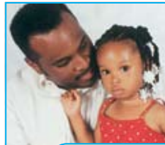
Durante las vacunas: