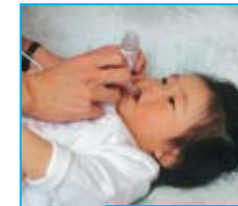
Cuando llegue a casa: