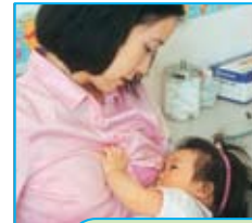
Después de las vacunas: