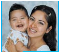
Antes de las vacunas: